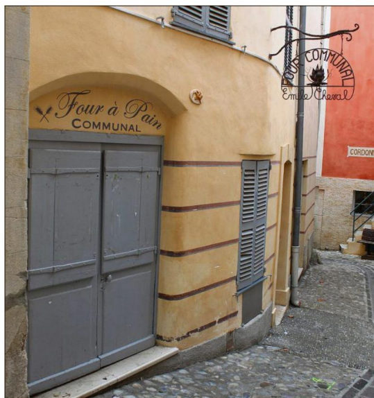
Le four qui est aujourd'hui occupé par une bijoutière est fermé depuis trois ans.